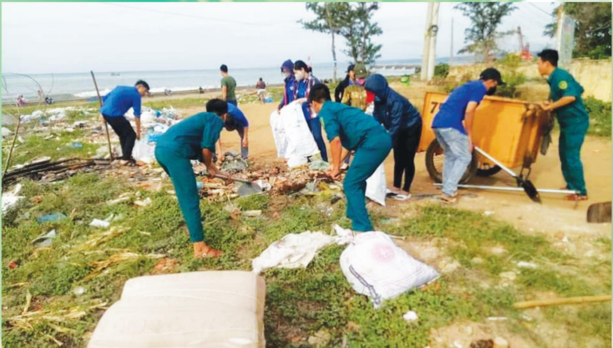
Dọn rác bảo vệ môi trường biển, hưởng ứng ngày Môi trường Thế giới (5/6) ở bãi biển Đồi Dương - Phan Thiết.