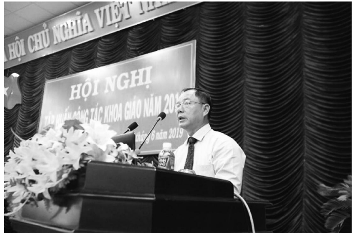
Đồng chí Hồ Trung Phước - UVBTVTU - Trưởng Ban Tuyên giáo Tỉnh ủy

Ban Tuyên giáo Tỉnh ủy tham mưu cho Ban Thường vụ Tỉnh ủy, Thường trực Tỉnh ủy lãnh đạo, chỉ đạo, triển khai, thực hiện toàn diện, đồng bộ có hiệu quả các mặt của công tác tuyên giáo; bước đầu đã xử lý thỏa đáng