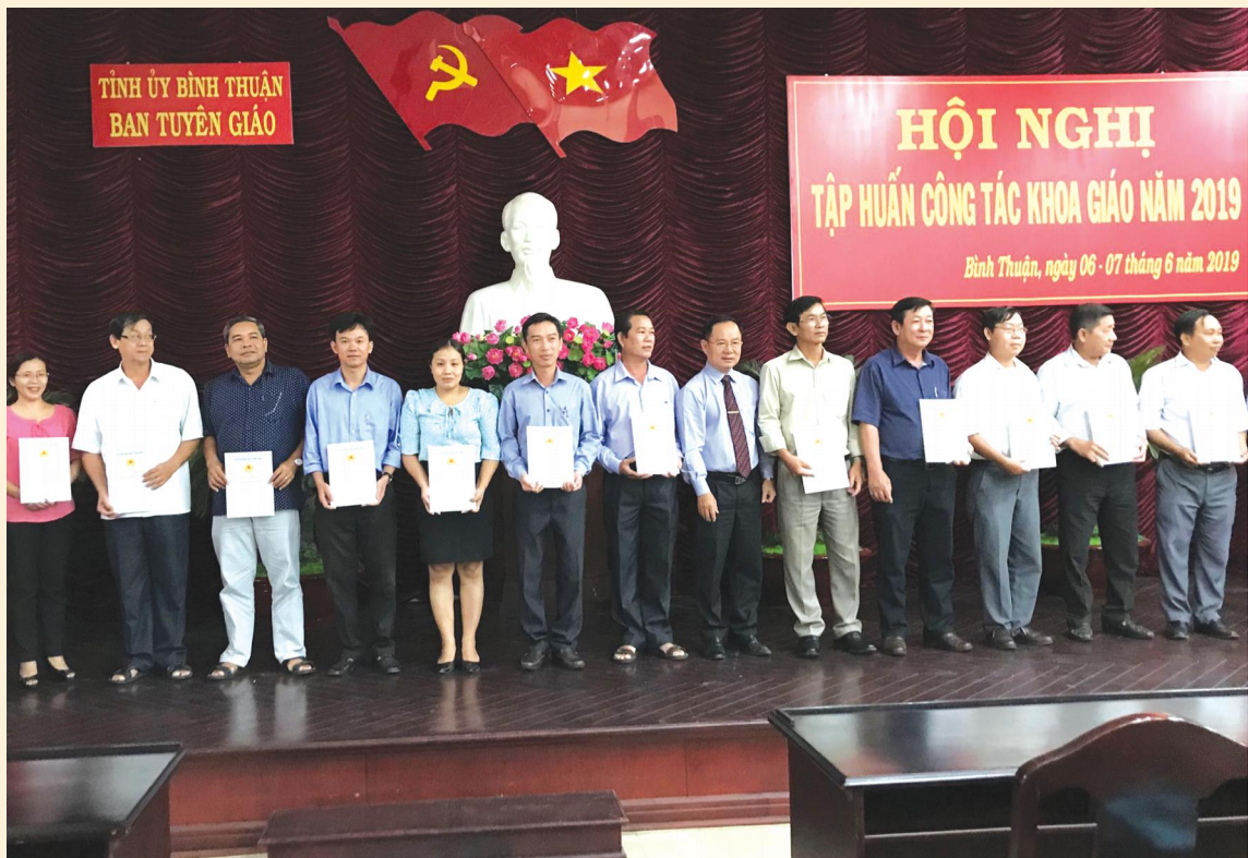
Hội nghị tập huấn công tác khoa giáo năm 2019.