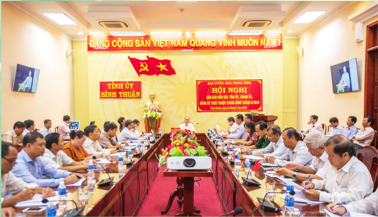
Hội nghị báo cáo viên các Tỉnh ủy, Thành ủy, Đảng ủy trực thuộc Trung ương tháng 6/2019.