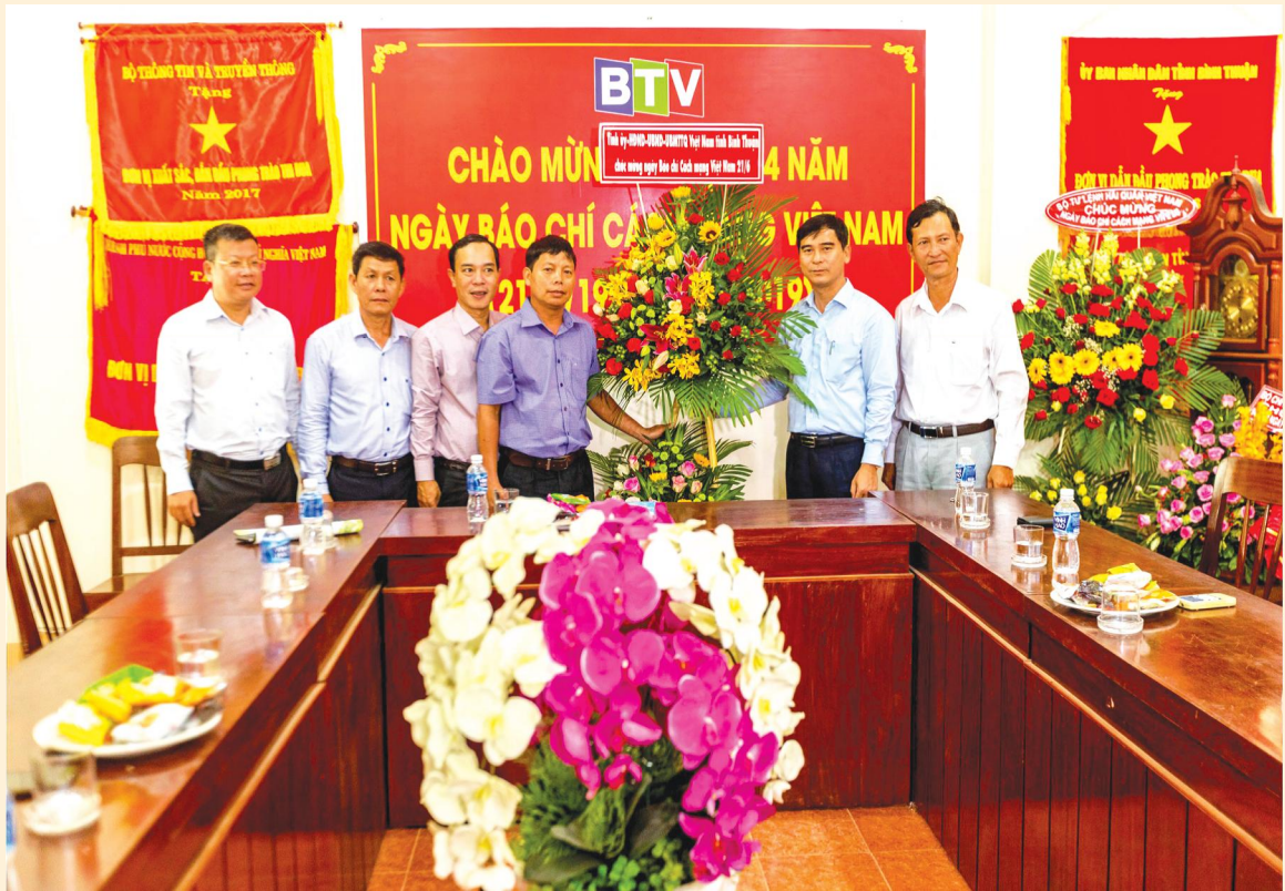
Lãnh đạo tỉnh thăm và tặng hoa Đài Phát thanh Truyền hình tỉnh nhân kỷ niệm 94 năm Ngày Báo chí cách mạng Việt Nam (21/6/1925 - 21/6/2019).